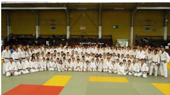
Les stagiaires et leurs entraîneurs dans la salle H. Salvador